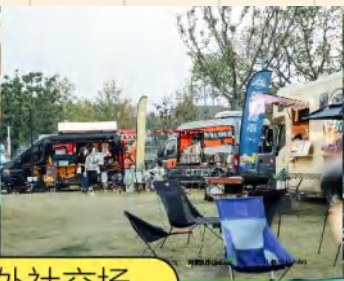
露营-户外经济-(游客、参会者)-不一样的乌镇体验-构建线下社交场