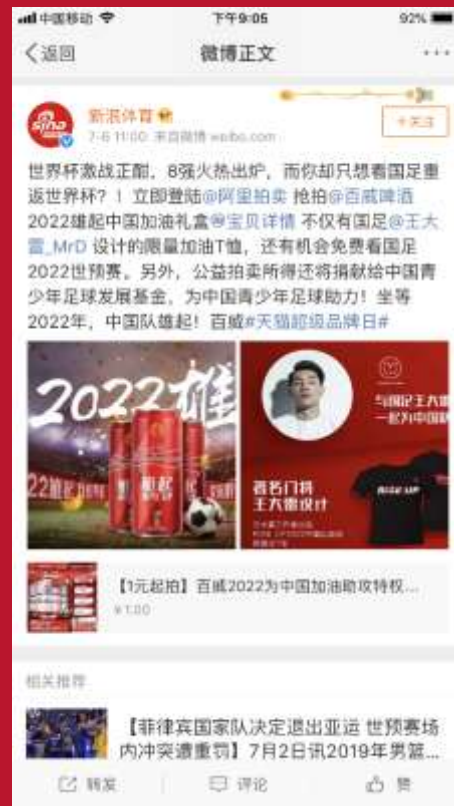
新浪体育助推发博