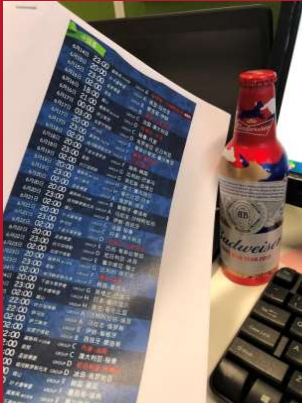
微博小编，枕戈达旦 喝着百威看球即时发红包