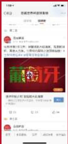
开赛前展示百威 倒计时视频