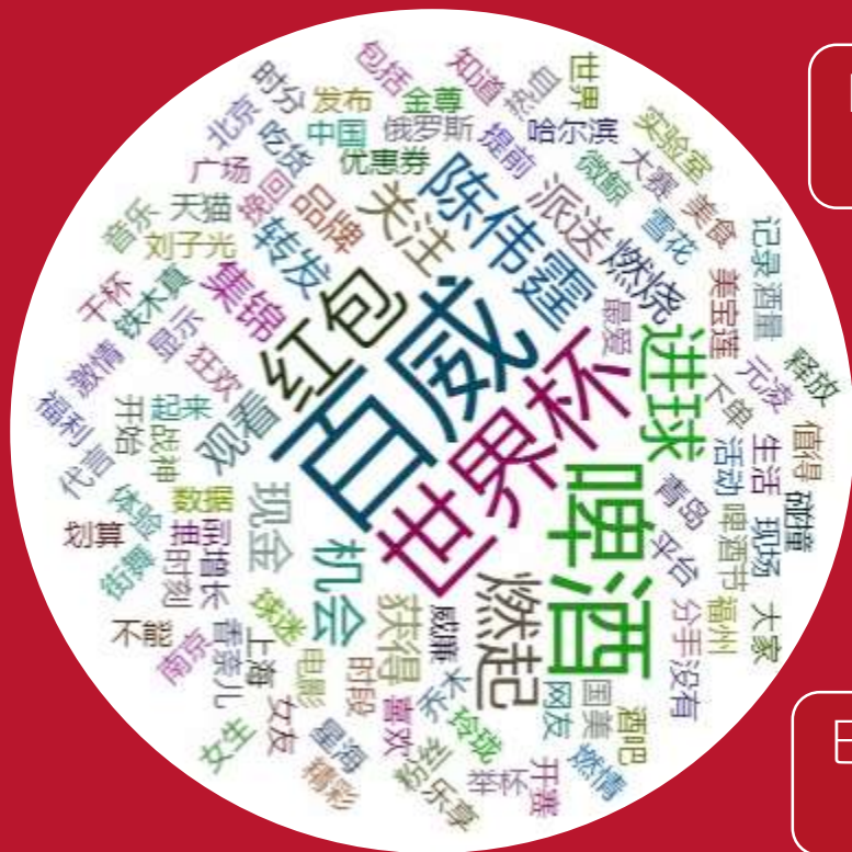
“百威” 6.13投放前1个月整体舆情