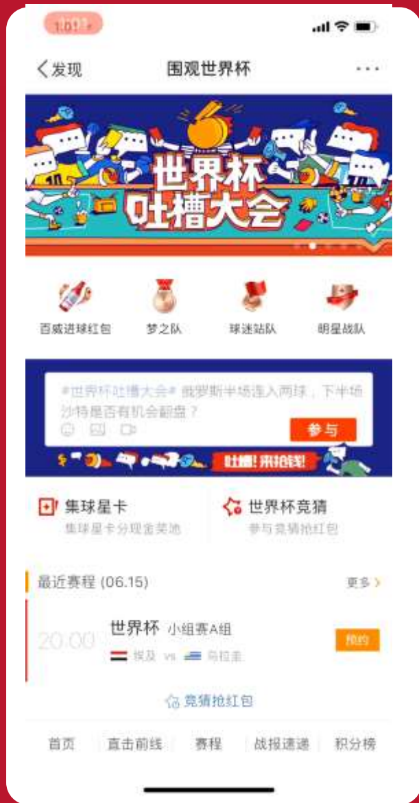
进球红包榜用户流程视频