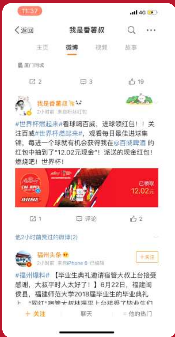
分享Social buzz领红包用户流程示意