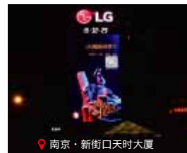
南京·新街口天时大厦