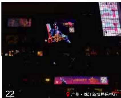
广州·珠江新城居乐中心