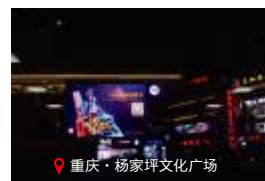
重庆·杨家坪文化广场