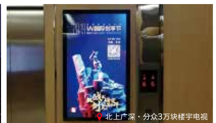
北上广深·分众3万块楼宇电视