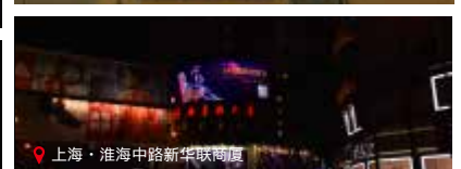
上海·淮海中路新华联商厦