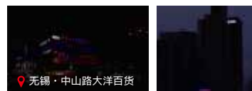
无锡·中山路大洋百货