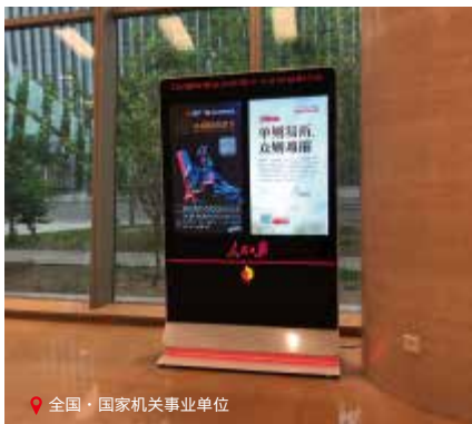
全国·国家机关事业单位