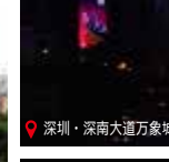
深圳·深南大道万象城