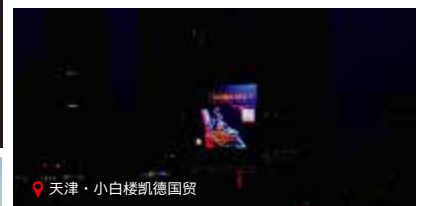
天津·小白楼凯德国贸