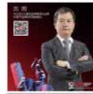
沈阳 万达宝莉王集团品牌管理总经理 沃数字品牌执行及副董事长