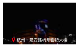
杭州·延安路杭州百货大楼