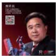
黄昇民 中国广告博物院馆长 中国传媒大学资深教授 IAI国际广告奖评委会主席