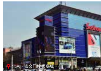
北京·崇文门搜秀商城