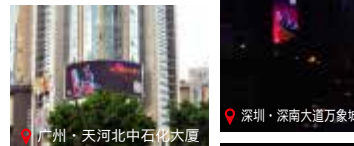
广州·天河北中石大厦